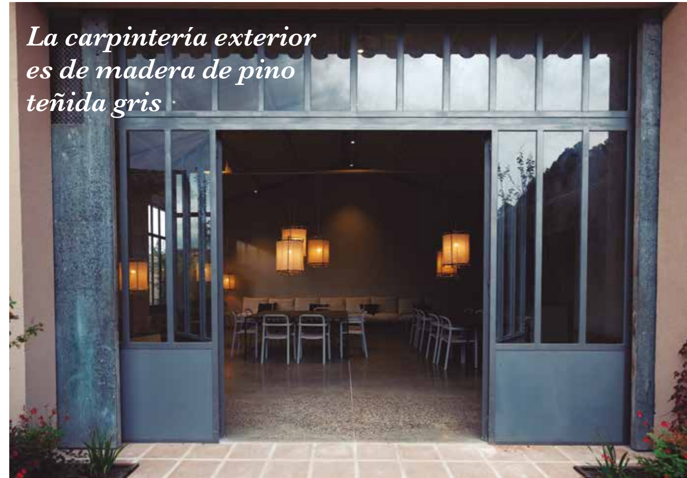
La carpintería exterior es de madera de pino teñida gris