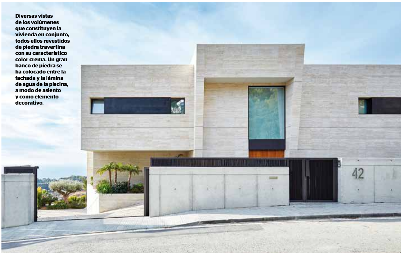
FOTOGRAFÍAS: ÓSCAR GUTIÉRREZ. TEXTOS: ADA MARQUÉS.

Diversas vistas de los volúmenes que constituyen la vivienda en conjunto, todos ellos revestidos de piedra travertina con su característico color crema. Un gran banco de piedra se ha colocado entre la fachada y la lámina de agua de la piscina, a modo de asiento y como elemento decorativo.